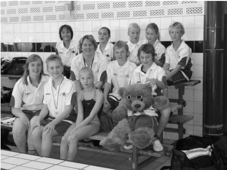
De Sopper maart 2011